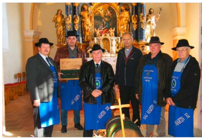
Blagoslov mladega vina pri sv. Ani, Veliki Vrh, november 2018