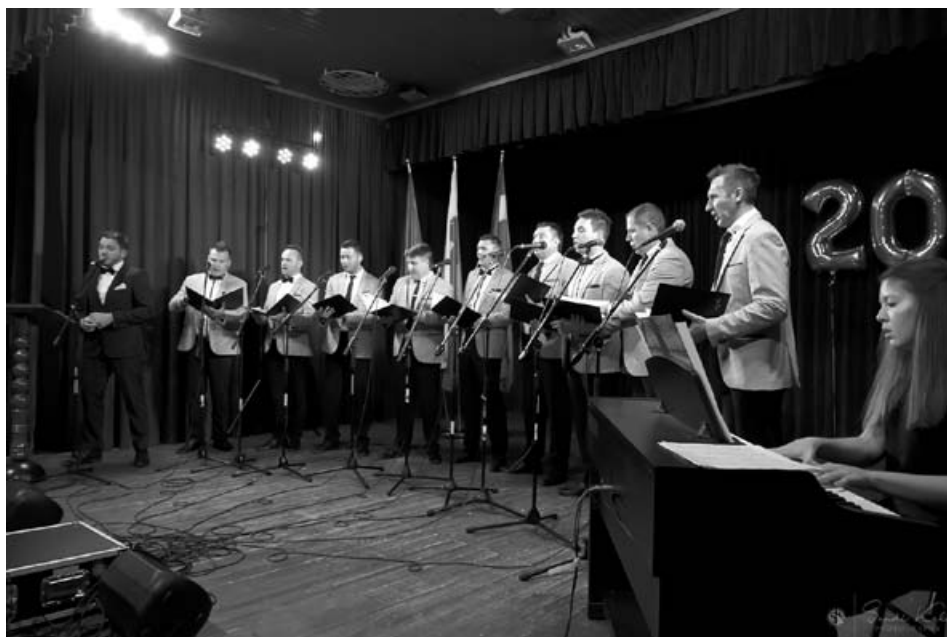
Mladi veseljaki ob okroglem jubileju na domačem odru.