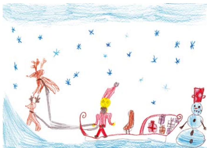
Žiga Žuran, 3. a