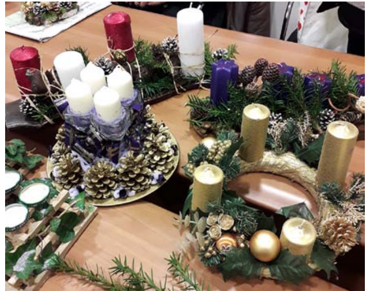
Izdelki gospodinj na praznični ustvarjalni delavnici

Ana Gabrovec, predsednica Društva gospodinj Cirkulane