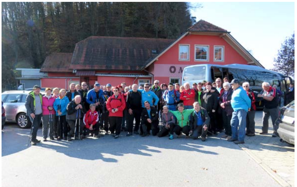
Utrinki z letošnjega Martinovega pohoda.

Opazovali smo čarobne barve gozda, narave, prisluhnili šepetu ptic, šelestenju listja pod nogami, prav tako pa uživali ob lepem vremenu, ki je bilo kot