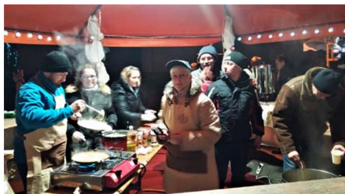
Letošnjo drsalno sezono smo odprli tudi s peko palačink.