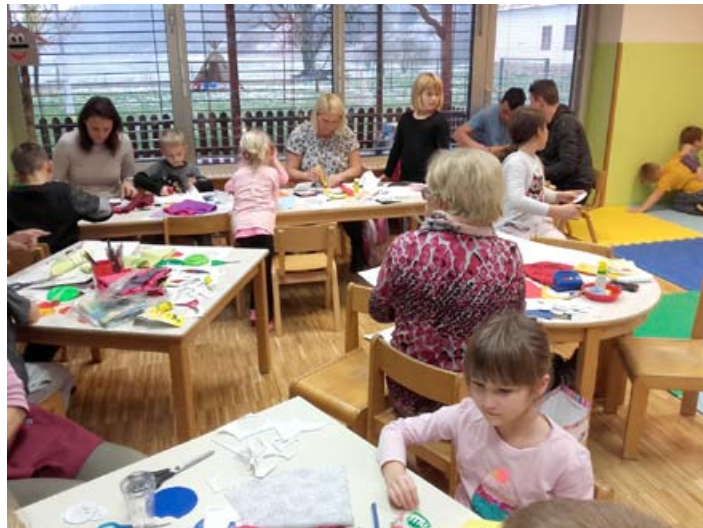
Ustvarjalni dan s starši in starimi starši

V prihajajočih dneh, ko bodo temperature postajale vedno nižje, bomo poskrbeli za okrasitev naše jelke, si ogledali lutkovno predstavo, poskrbeli za pospravljene kotičke, predvsem pa napisali pismo in narisali risbico trem dobrim možem. Prepričani smo, da bomo tudi letos dobili kakšno darilce pod našo jelko, saj smo navsezadnje bili preteklo leto zelo ustvarjalni, pogumni in aktivni. Dodatne dejavnosti bomo pridno izvajali še naprej, ob snežni odeji se pogumno zapodili na dvorišče ter poskrbeli za gibalno športne dopoldneve,