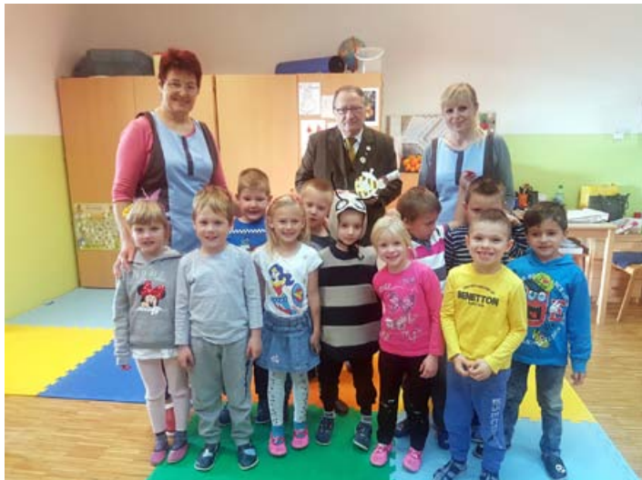
Tradicionalni zajtrk smo preživeli v družbi čebelarke družine Cirkulane

Ker se meseca decembra vse odvija zelo pravljичno in bleščeče, a žal s hitrim tempom, smo v vrtcu ob vseh aktivnostih zavihali rokave tudi vzgojitelji in izpeljali še en dodatni projekt. Kako okrasiti prizorišče, kjer se izpolnjujejo velika pričakovanja otrok? Kako poskrbeti, da bo druženje ljudi čim bolj sproščeno, prijetno in nadvse pravljичno? Kako pravljичno nakazati prihod veselega decembra ter se obenem imenitno razgibati na drsališču? Kako vse »to« zapakirati v celoto in postaviti v okolje, kjer vremenske razmere govorijo vedno po svoje? Ker nam idej nikakor ne primanjkuje, smo se lotili dela in pričeli pridno ustvarjati. Naši najmlajši so bili deležni marsikatero ure igranja več, a obenem bili strogi ocenjevalci našega ustvarjanja. Vprašanja »Zakaj je to tako?«, »Kaj pa delaš zdaj?« so bila redno na seznamu, a ob koncu je bil sprehod skozi »Čarobni svet Vile Bele« res pravljičen in kar je najpomembnejše, očarljiv za otroke. Tako smo vzgojitelji dobili še eno veliko petko »v redovalnico« od naših najmlajših prijateljev.