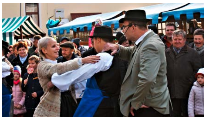
Nedelja, 2. decembra je bila pri sveti Barbari v Cirkulaneh praznično obarvana.