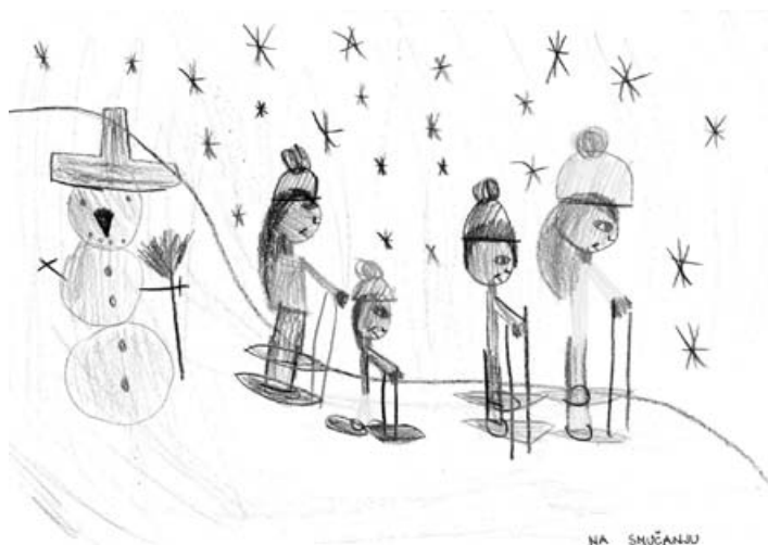
Nia Žuran, 2. a