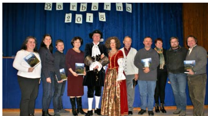
Na Barbarno je bila predstavitev turističnega vodnika

Skratka vse, kar Belani počnemo, kar ponujamo in na kar smo ponosni. Vse to smo strnili v dokument, ki ga bomo z veseljem pokazali turistom, pohodnikom in vsem naključnim gostom. Tudi za nas – Belane bo to zanimivo branje opremlje-