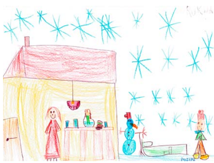
Rukija Novalić, 2. a