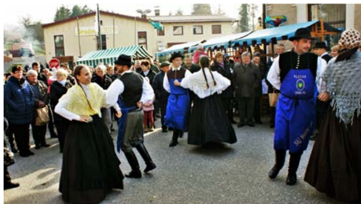
Nastop na Barbarnem.

Za nami je torej kar nekaj nastopov, naš zadnji pa smo