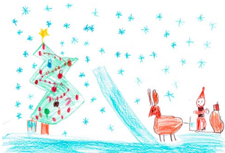
Aljaž Emeršič, 3. a