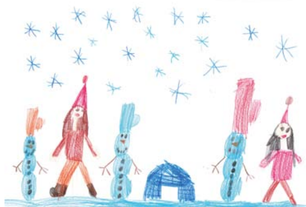
Vita Obran, 1. a