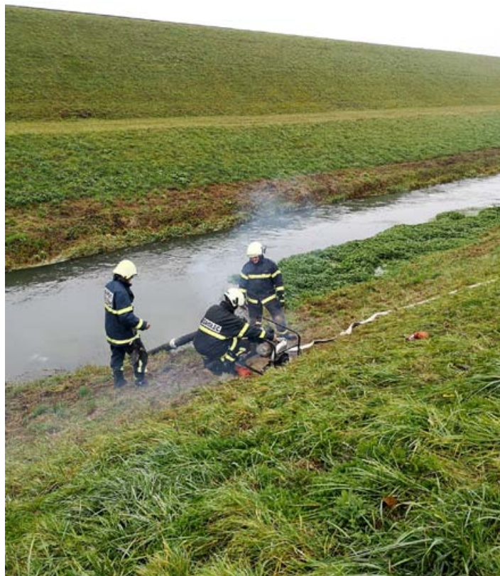
Cirkulanski operativci na jesenskem pregledu operativnih enot