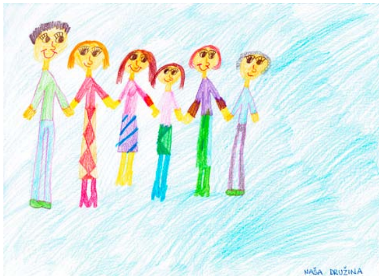
Maša Kozel, 2. a