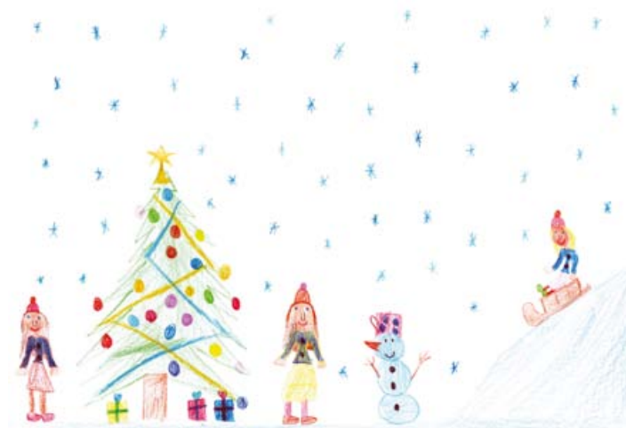
Ela Kozel, 3. a