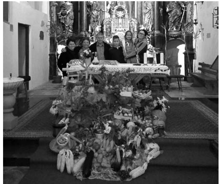
Okrasitev v župnijski cerkvi na zahvalno nedeljo