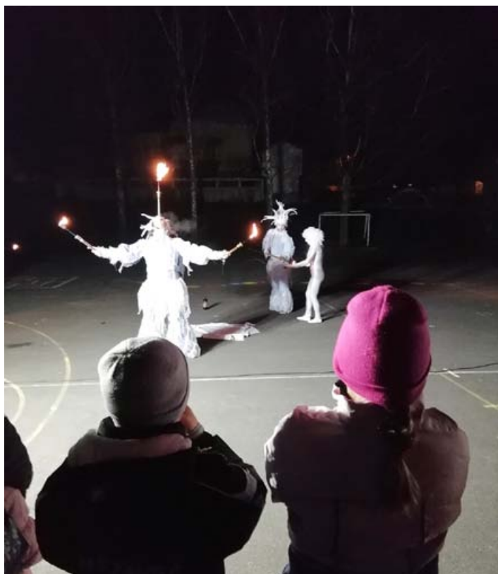
Utrinki s slavnostnega odprtja drsališča v Čarobnem svetu vile Bele.