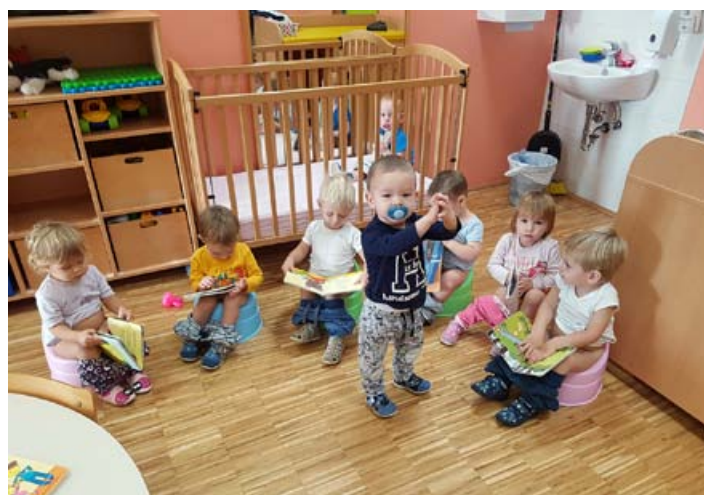
Medtem ko se pridno odvajamo od pleničk, preberemo še kakšno pravljico